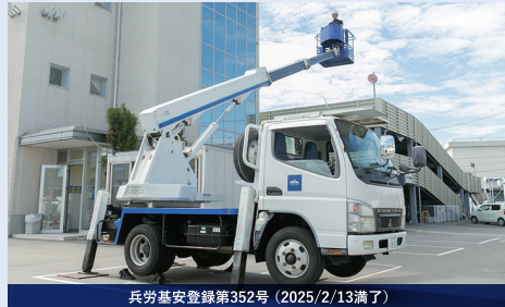
兵労基安登録第352号 (2025/2/13満了)

電気工事、造船所等での高い部分の塗装等にも利用されています。技能講習を修了すると、作業床の高さが10m以上の高所作業車を操作することができます。