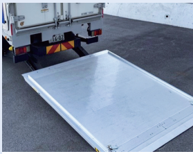
テールゲート特別教育