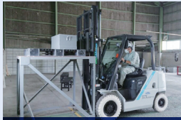
兵労基安登録第355号 (2025/2/13満了)