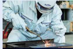
兵労基安登録第354号 (2025/2/13満了)