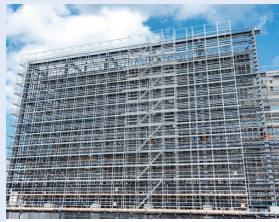
足場の組立て特別教育