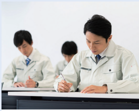
職長教育/職長・安全衛生責任者教育