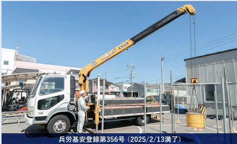
兵労基安登録第356号 (2025/2/13満了)

トラック等への資材の積み込み・積降し等によく用いられます。技能講習を修了すると、1トン以上5トン未満の小型の移動式クレーンを操作することができます。