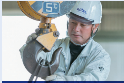
兵労基安登録第353号 (2025/2/13満了)