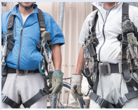
フルハーネス特別教育